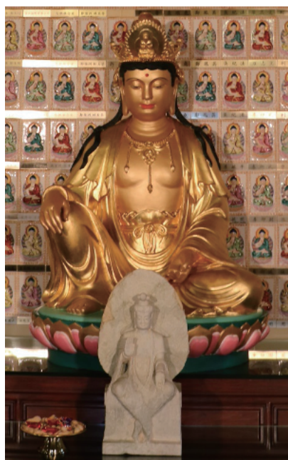
供奉在萬佛寶塔第八層的兩尊彌勒 51

彌勒以無數化身救渡芸芸眾生。所以在佛寺中，會有不同形象的彌勒造像。例如萬佛寶塔第八層供奉的「天冠彌勒」，形相莊嚴，與天王殿供奉的身體肥胖而笑口常開的彌勒佛，造形極不相同。