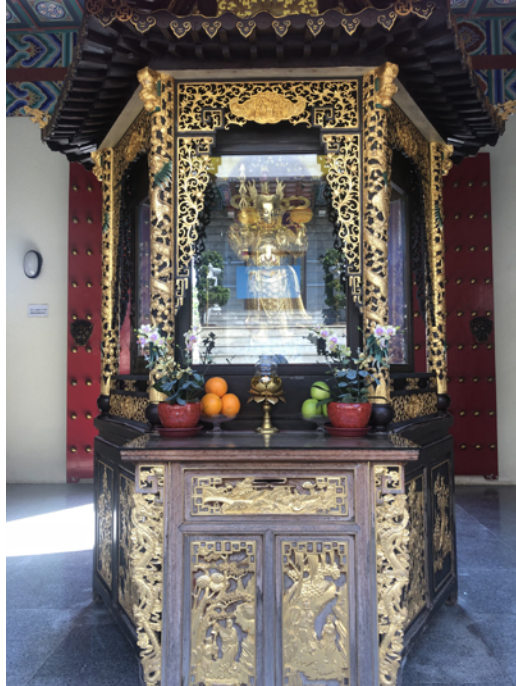
面向天王殿 (出口) 北門的韋馱菩薩